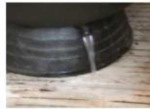
Bouchon de drain (Filtreur à sable)