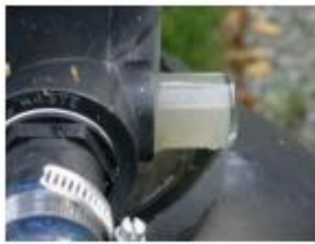
Bouteille de backwash